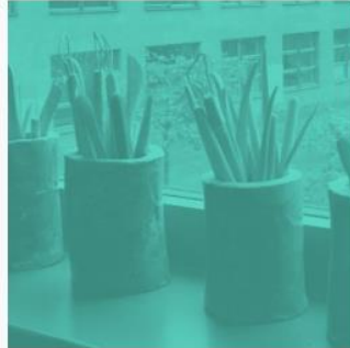
7. Klasse 2023/24